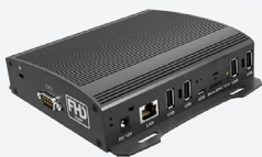
Door Tablet ABX

Door Tablet ABX/WBX est notre appareil compact qui permet de saisir les affichages d'orientation de Door Tablet sur vos écrans communs (par exemple dans les zones d'accueil, près des ascenseurs ou des halls d'entrée). ABX est un appareil android. WBX fonctionne sous Windows. Il se connecte à un ou plusieurs écrans tactiles ou non tactiles via HDMI et USB. Il suffit de le brancher sur vos écrans existants et vous êtes prêt à visualiser tous les panneaux d'affichage d'orientation que nous proposons, y compris les horaires et les plans d'étage.