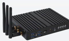
Door Tablet WBX